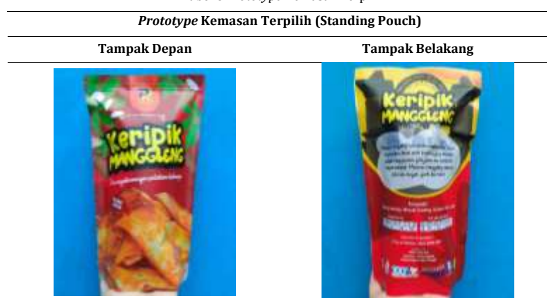
Tabel 8 Prototype Kemasan Terpilih

Pada alternatif 1 kombinasi terpilih yaitu A3B2C1D2E2F1 dengan nilai performansi sebesar 74,914, dengan kriteria bentuk kemasan standing pouch, bahan kemasan paper metalize, laminasi kemasan doff, kombinasi warna ada 3 jenis, berat bersih 250 gr, dan harga kemasan pada range Rp. 1000 - Rp.5000, sehingga dengan pertimbangan respon teknis yang telah dibuat, merujuk pada dimensi kemasan yang sesuai dengan kapasitas, dikarenakan berukuran 250 gr, maka dimensi kemasannya berukuran 16 x 27 cm. Kemudian untuk kombinasi warna 3 warna yaitu warna coklat, kuning, merah dan hijau disesuaikan dengan varian rasa produk original, pedas manis, jagung manis, balado.